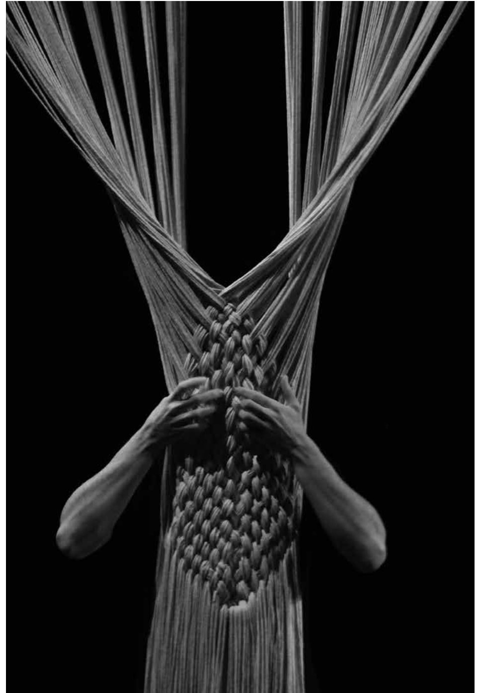
© DROITS RÉSERVÉS - CIE LUNATIC