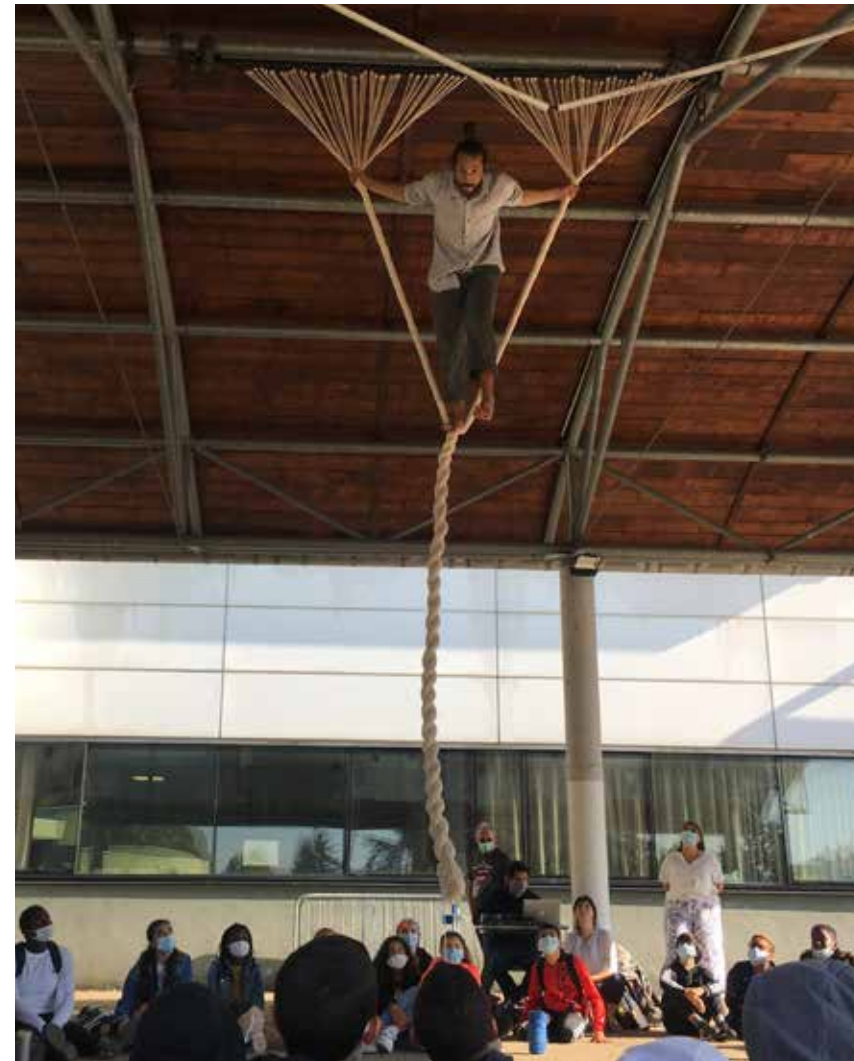
DE SES MAINS AU COLLÈGE ST EXUPÉRY À EAUBONNE (95) - ©CIE LUNATIC

Pièce sonore de Sika Gblondoumé avec les voix des élèves du Collège Saint Exupéry à Eaubonne (95) : Extraits