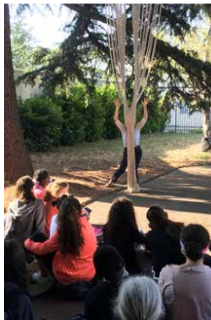
DE SES MAINS AU COLLÈGE ST EXUPÉRY À EAUBONNE (95)