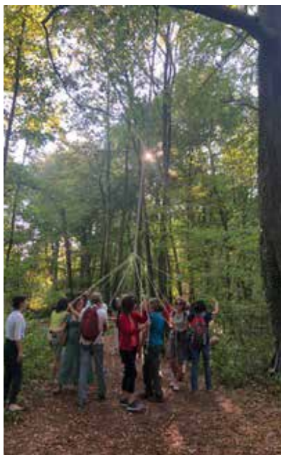
L'ARBRE DE MAI AU FESTIVAL GRAND BOL D'AIR (60)