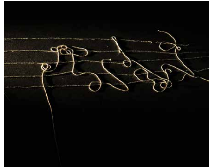
© CÉCILE MONT-REYNAUD - FIL QUI TRACE UNE PARTITION GRAPHIQUE

La parole du monde - Praline Gay-Para et Geneviève Calame-Griaule