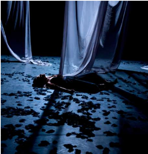
ELSE(S) D'ARTHUR SCHNITZLER – CRÉATION 2021