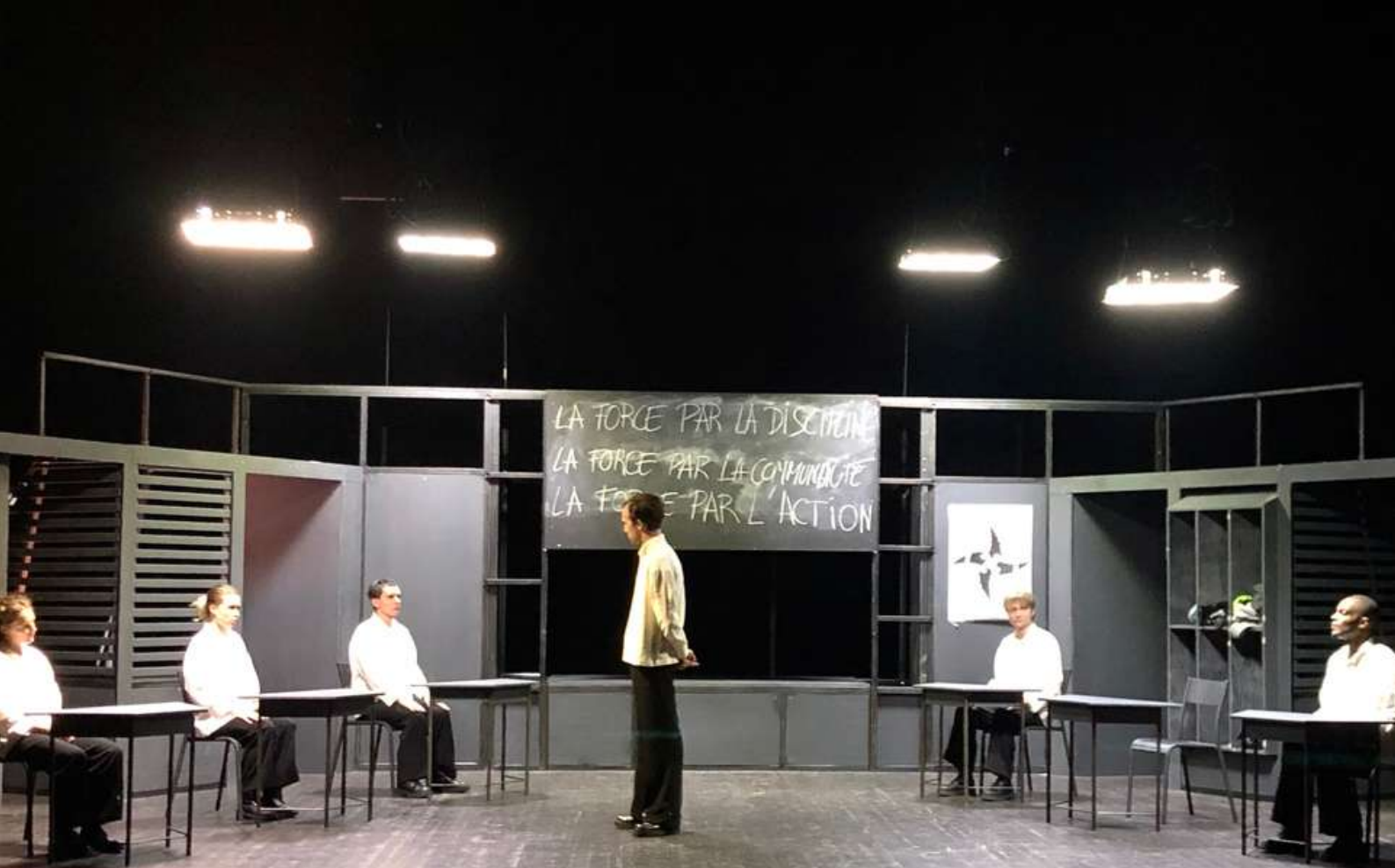
photos de répétitions