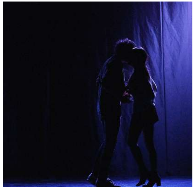
ROMÉO ET JULIETTE DE WILLIAM SHAKESPEARE – CRÉATION 2016