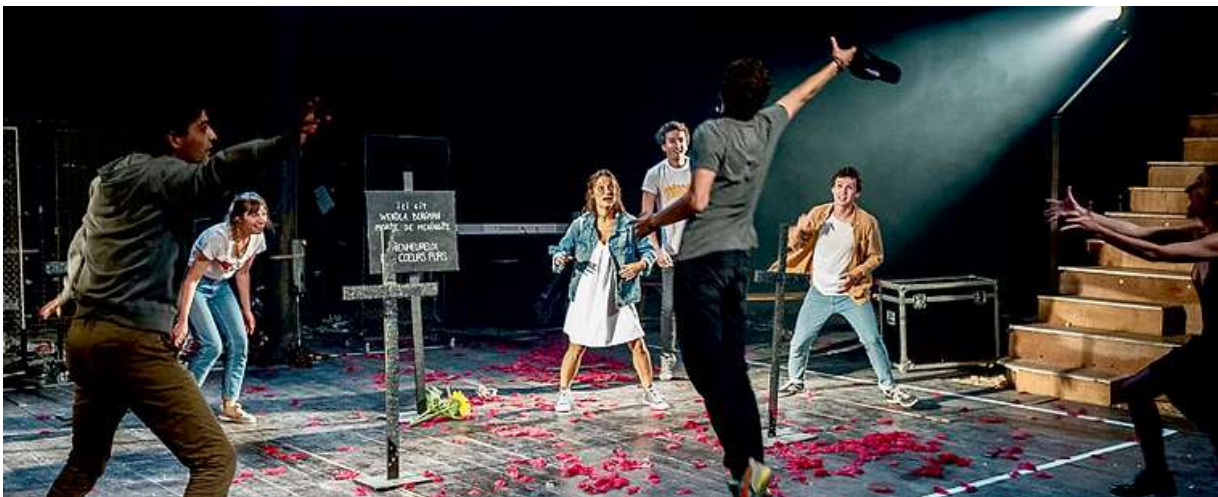
L'ÉVEIL DU PRINTEMPS D'APRÈS FRANK WEDEKIND – CRÉATION 2018