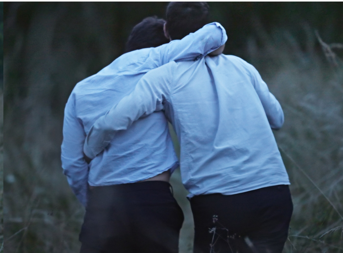
Sur l'autre rive

Une vaste propriété, décatie par les années et le manque de moyen.