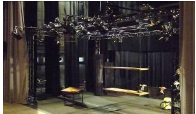
Structure au sol en cours de montage.

Plateau (mur à mur) : Dimensions optimales : L 9m x P 8m x H 3,70m.